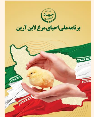
احیای مرغ لاین آریین و ورود به زنجیره تولید پس از ۲۰ سال