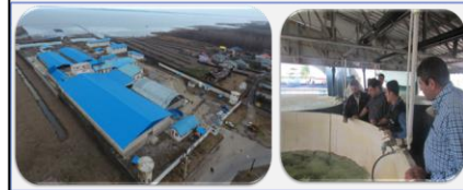
طراحی و پیاده سازی الگوی تکثیر و پرورش ماهیان خاویاری بومی دریای خزر