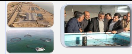
طراحی و مدیریت اجرای احداث اولین مرکز تکثیر و پرورش ماهی در قفس ماهیان بومی خلیج فارس