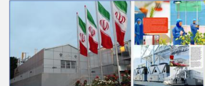
طرح کلان ملی ساخت اولین گلخانه تراریخته با سطح ایمنی BL3