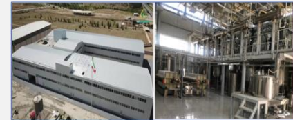
احداث اولین پایگاه گیاهان دارویی کارخانه تولید شیرین کننده طبیعی از گیاه استویا