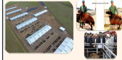
طراحی و مدیریت اجرای احداث اولین مرکز سنتر گوسفند ایرانی با قابلیت پرورش صنعتی