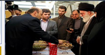
طرح کلان ملی انگشت نگاری DNA گیاهان باغی