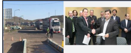
واردات زمینی گاو از اروپا برای اولین بار در تاریخ دامپروری کشور

قرارگیری در میان ۱۰۰ سرآمد علمی کشور بیش از ۱۴۰۰۰ ارجاع مقاله در جهان اچ ایندکس: ۳۵