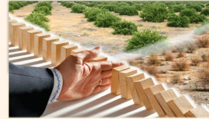
مدیریت بیماری جاروک لیموترش برای اولین بار در جهان