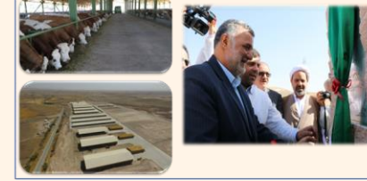
طراحی و اجرای احداث اولین دامداری و مرکز تولید نهاده های ژنتیکی گاو دو منظوره سیمنتال